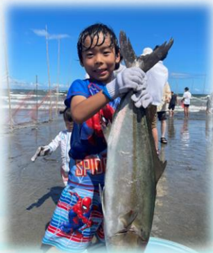
子供達も大きな魚を GET!