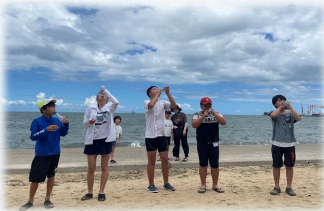
ラムネ早飲み大会