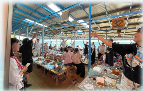
白熱のじゃんけん大会